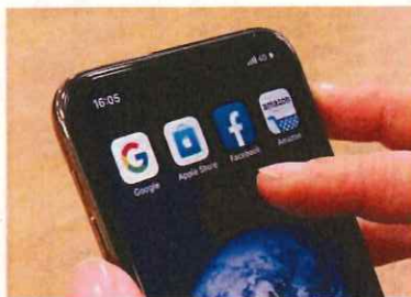
議論を受け、GAFAの納税方針にも変化の兆し

益と見なし、それを売り上げに応じ各市場国に配分して、各国が法人税を課すものだ。また多国籍企業の多くがブランドや特許などの無形資産を軽課税国に移し、市場国での利益を無形資産使用料支払いの形で軽課税国に移転している。これも利益の一定部分の移転を認めないことにする。2つ目の柱は、多国籍企業の租税回避で活用されるアイランドなど軽課税国の封じ込めだ。軽課税国にある子会社の利益についても、親会社のある国で一定税率での課税を行うなどの案が有力だ。「7月のG20サミットまでに残された主要な論点について合意できるかがカギ」（財