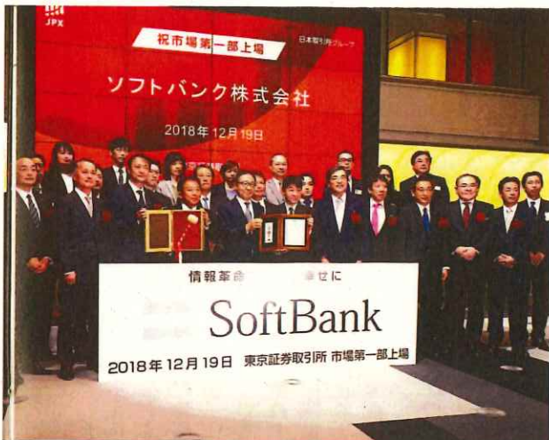
ソフトバンクの上場を祝う東証でのセレモニー風景