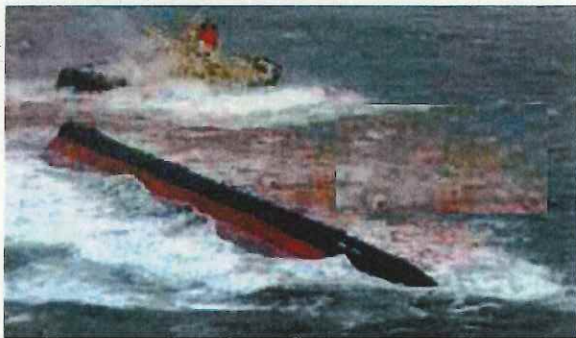
＜走錨し、座礁・転覆した船舶です。＞