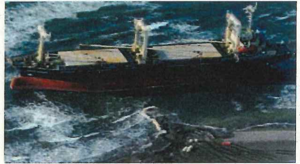
＜走錨し、砂浜に乗揚げた船舶です。＞